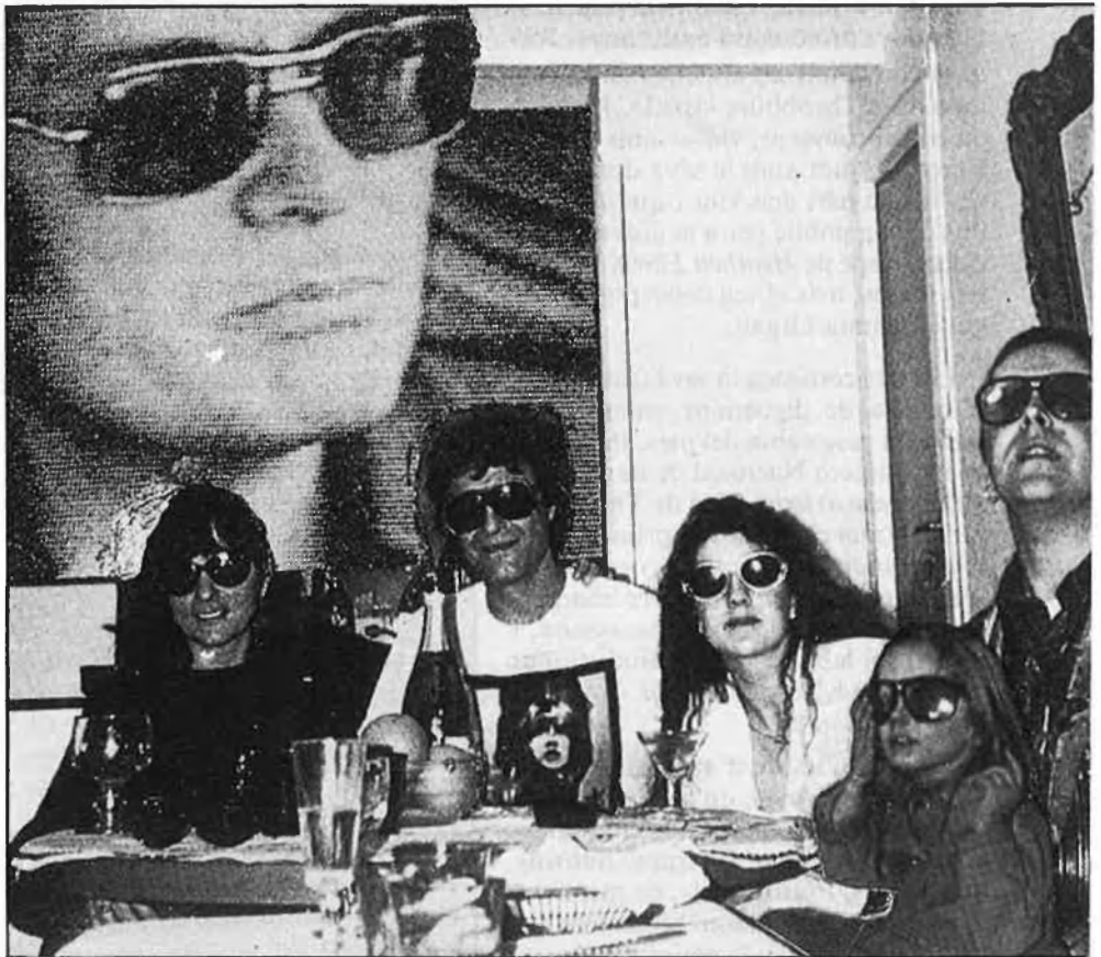
La «família» Valls, al complet.

—Bé, el tema del pacte de Nunez amb TV espanyola és més important del que es pensa. Els que el defensen diuen que és interessant per tal que el club tingui millor imatge a nivell d'estat. I a mi em sembla que la manera de donar una bona imatge no és aquesta, sinó que TV3 vengui els drets a televisió espanyola. És molt significatiu: TV espanyola pot emetre per tot Espanya i TV3 ha de quedar reclosa a Catalunya. El que hem de defensar és justament tot el contrari, que TV3 sigui una televisió normal; és a dir: que no només circuli a l'interior, sinó que pugui emetre cap a fora. Aquest pacte és en tot cas un símptoma ben evident del que alguns pretenen fer amb la nostra televisió. □