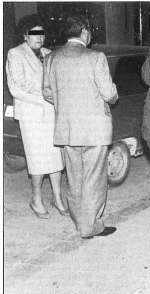
Patrulles nocturnes de ciutadans a la Malva-rosa.