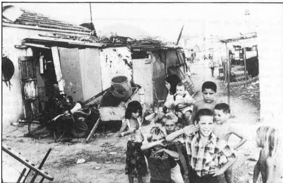
¿Delinqüents o simplement gitanos?

Quan abandonem la ronda nocturna —que durarà fins a la matinada—, els patrullers s'interroguen: «¿per què dimonis la policia no entra en les seues cases i els deté, si ho sap tot?» La resposta pot ser múltiple. A Alacant, per exemple, l'associació de veïns del nucli antic —que també va arribar a patrullar— va acusar diversos delinqüents de ser «delators i confidentes a sou de la policia».