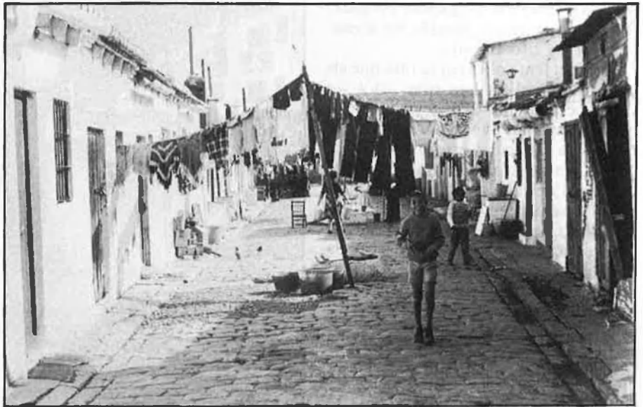
Barriada habitada per gitanos a la Malva-rosa.

Per a eixir a patricular de matinada compten amb una variada armeria, un arsenal complet: pals de beisbol, escopetes de perdigons, ferros, porres metàl·liques, rifles i també pistoles —«de gent que té llicència, jeh!»—. Tots poden, en un moment determinat, llançar, disparar o colpejar amb un objecte contundent un presumpte traficant o lladre. Quasi ningú, però, mostra la seua arma. En la furgoneta en què anem repetint el mateix recorregut durant unes quantes hores, dels dos patrullers només un esgrimirà, de tant en tant, una ferma i potent porra folrada de goma. Quan s'acosta un altre cotxe, amaguen els ferros ràpidament sota els baixos del seient i l'amo es trau el passamuntanyes que, com altres de