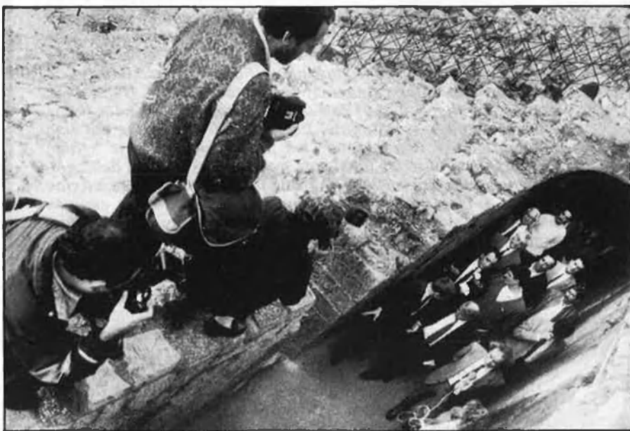
Els protagonistes es donaren cita a Sagunt.