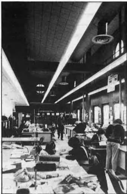
Redacció d'informatius a Sant Cugat.