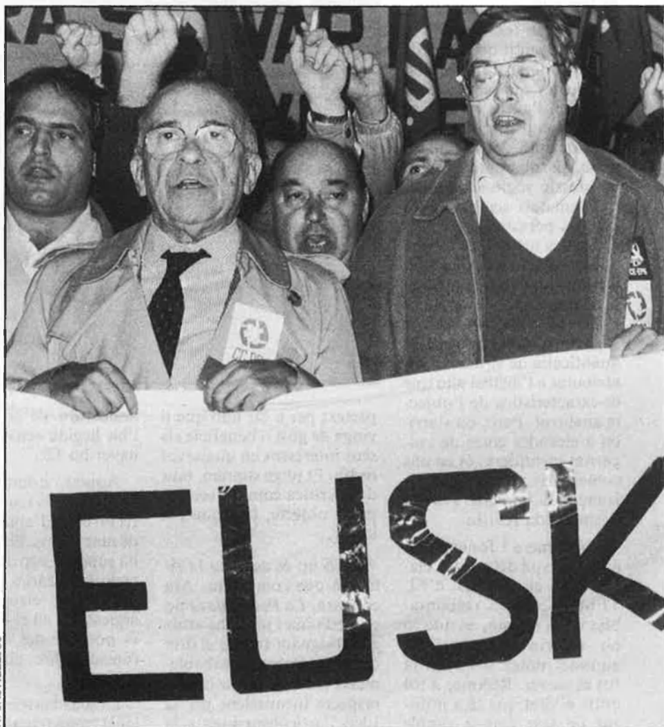
Santiago Carrillo, darrere una pancarta de CCOO.

En canvi, el partit per a la Unitat dels Comunistes de Santiago Carrillo rebutjà la participació en el procés. Calla, doncs, acabar-lo d'aïllar. Quan