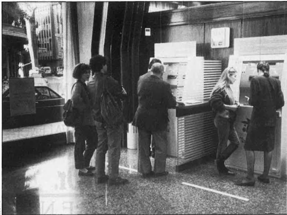
Nou servei Caixa Ràpida, ja a València.

—¡No! És impossible. El que hi ha clar és que se'n reduirà l'ús per raons