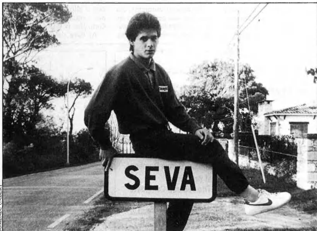
L'Angel Nieto és irrepètible. No tornarà a sortir-ne mai cap».

—Possiblement, llavors, hauria estat amb el Miralles i l'Aspar.