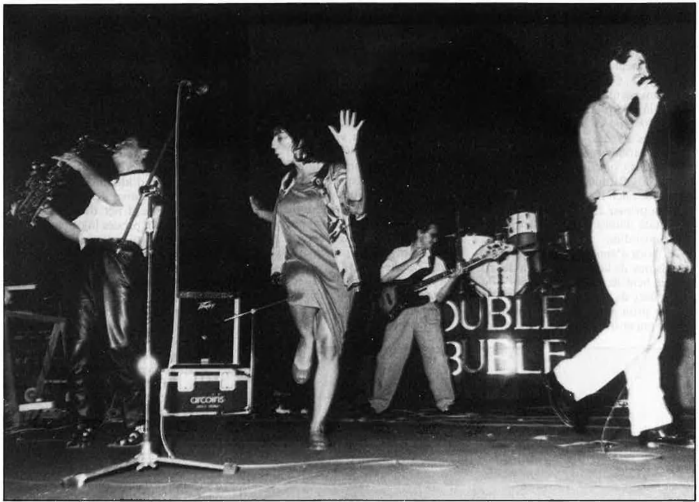
ROC CATALÀ: ¡DÉU L'EMPARI!