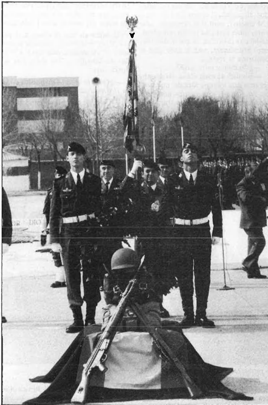
L'OBJECCIÓ DE CONSCIÈNCIA A DEBAT