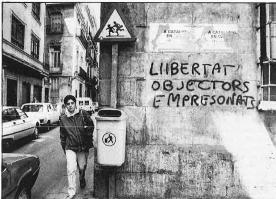
Amnistiar els objectors més antics, una de les opcions amb més probabilitats de les estudiades pel govern.

Mentrestant, el tercer protagonista del conflicte, el poder militar, pressiona des de l'ombra i deixa sentir els seus efectes en fets consumats. □