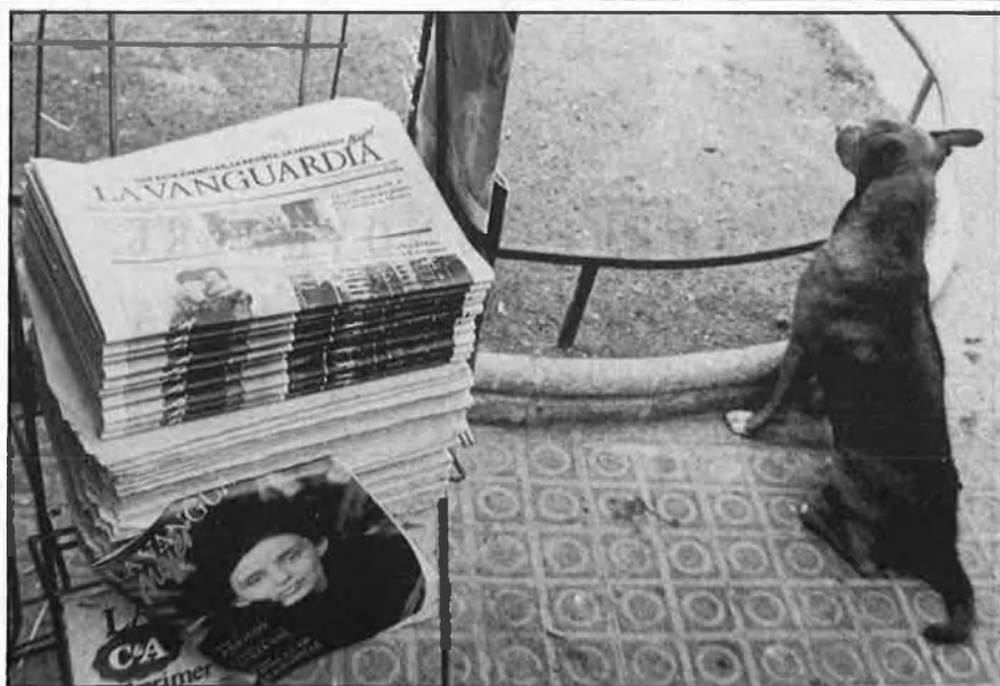
Canvis en «La Vanguardia», centre de totes les mirades polítiques.