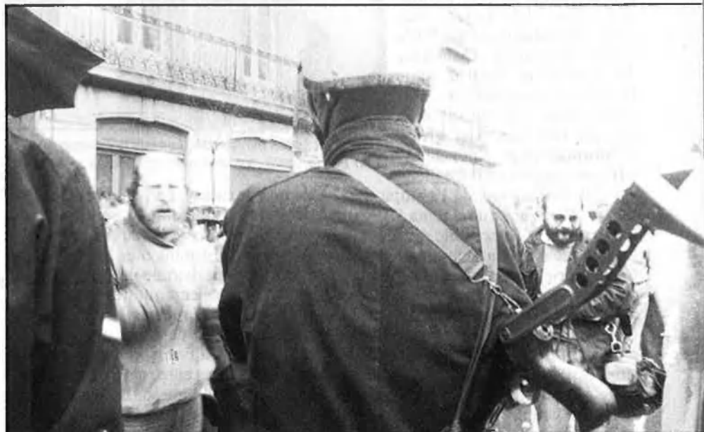
A l'esquerra, atemptat contra una firma francesa a Algorta, com a protesta per un assassinat dels GAL. Dalt, a l'esquerra, atemptat d'ETA a Madrid. Baix, actuació de l'Ertzaintza.

cerca de solucions als seus presos i exiliats.