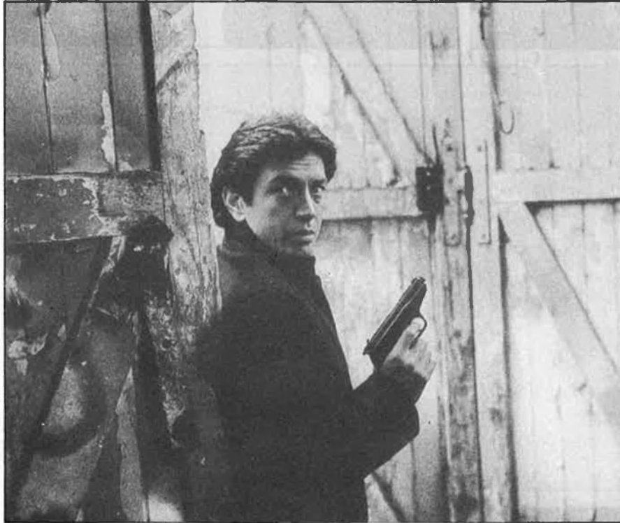
Bernard Giraudeau en «L'Home volé».

En l'apartat negatiu, caldria insistir en la desorganització del certamen,