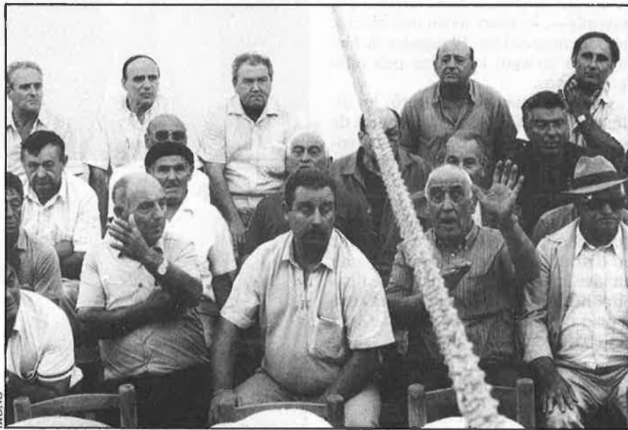
El públic, el vertader espectacle.

L'espectador tradicional, amb el feix de bitllets per jugar i el puro a la boca segueix anant al trinquet perquè hi ha anat tota la vida. Ara, això és evident, disfruta més que mai. Tot això que es troba. De vegades, com aquest 3 d'octubre, el final pot ser d'apoteosi. El públic també juga, amb diners almenys.