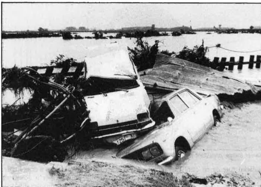
Una imatge de fa cinc anys, encara present entre la població.