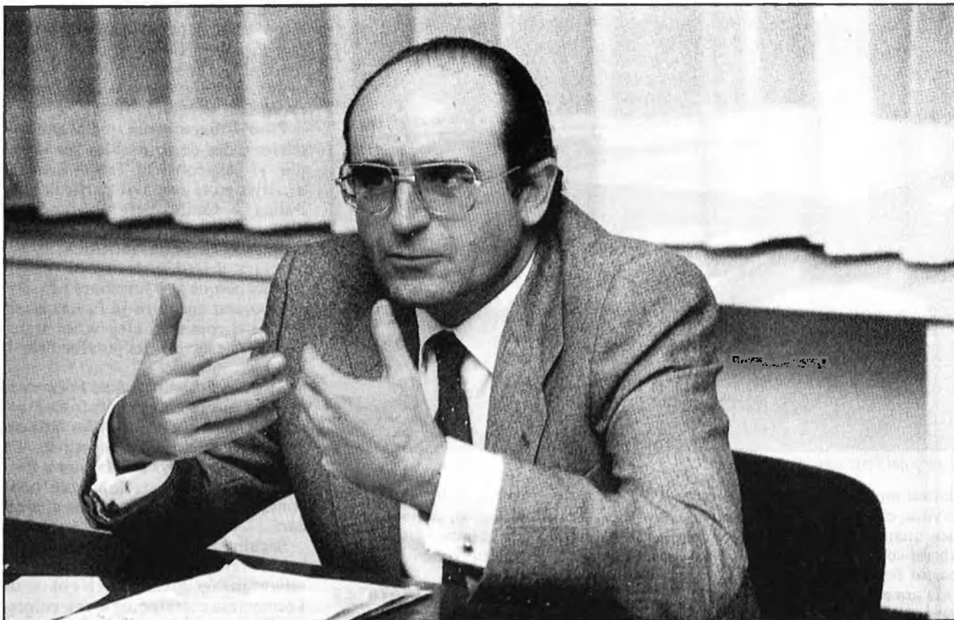
Abel Matutes: en tot moment ha volgut distanciar-se de l'afer. Baix, la controvertida discoteca Ku.

d'uns terrenys propietat d' Abel Matutes , el qual, davant la posició tancada i formant bloc del consistori formenterenc, governat pels socialistes, hauria tingut difícil qualsevol altra