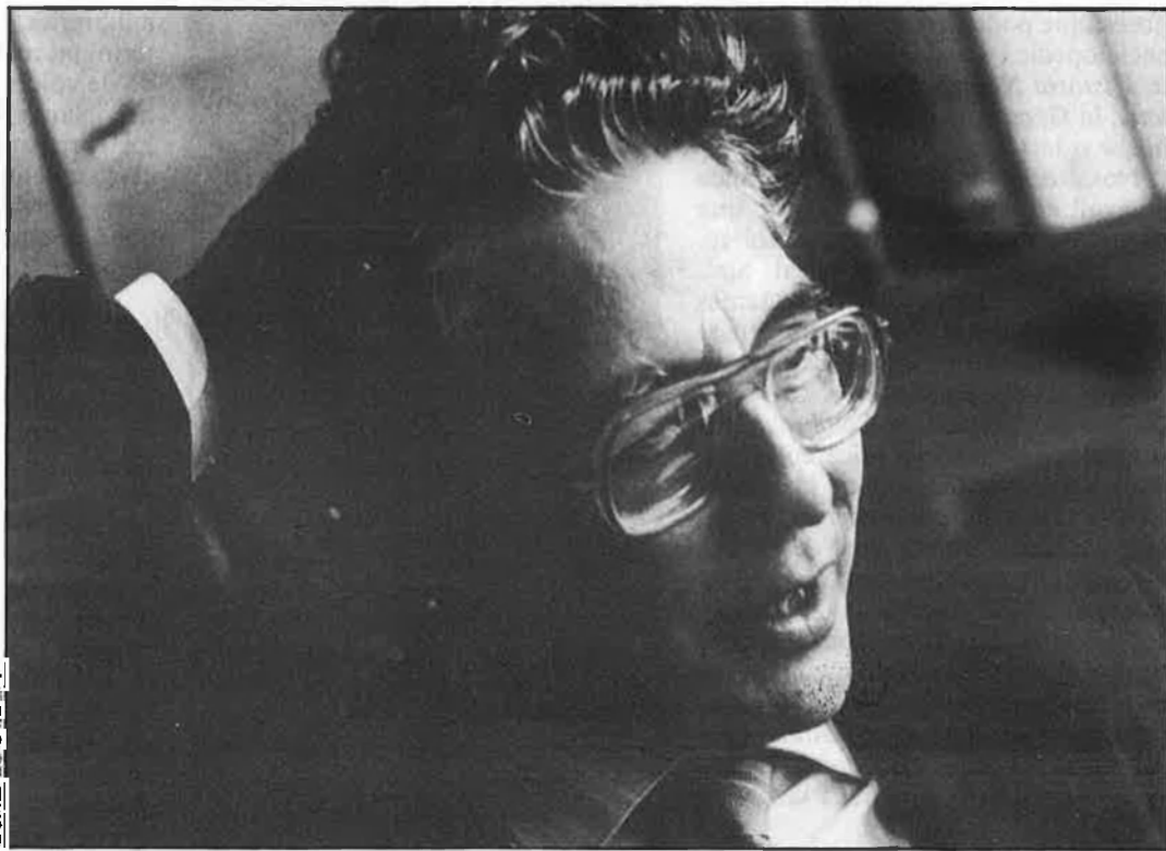
«Caldria que els mitjans de comunicació dediquessin més espai a temes relacionats amb el llibre i la lectura».

Des del punt de vista de premiar amb una quantitat més forta i d'empènyer el premi endavant, si hi ha una entitat de crèdit que ho fa, potser no cal que hi hagi tanta gent. És a dir, jo crec que el nostre paper deixava de ser necessari. Però això no vol dir que hi hagi cap