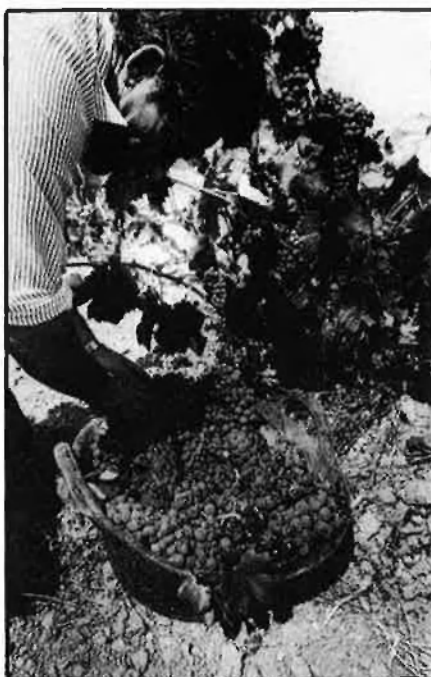
Temporers valencians: de la vinya a casa, i de casa a la vinya.