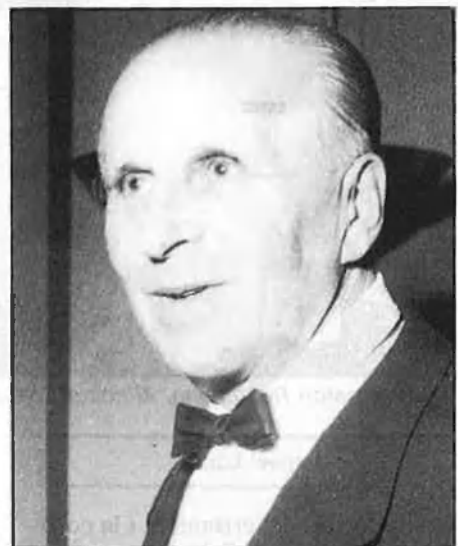
A l'esquerra, Gide (assegut), Schumberger, Jacques Rivière i Roger Martin du Gard. Dalt, Gallimard, adolescent i ja vell.

cat per un altre editor, escriu a l'autor i li ofereix d'entrar a formar part de la família gallimard. Aquest és el cas de Proust, a qui havien rebutjat el primer llibre d' A la recerca del temps perdut , a causa dels informes negatius de Gide i del seu equip. Gaston Gallimard s'adona de l'error i fa mans i mànigues perquè Proust entri al seu catàleg. Ho aconsegueix amb tacte i perseverança, visitant Proust a les nits, ja que de dia dorm i no vol ser molestat. També aconsegueix fitxar Simenon, amb el qual accedeix a signar un contracte inèdit: el creador de Maigret demana el 50 per cent dels beneficis i Gallimard, malgrat el consell dels seus assessors, accepta, ja que té total confiança que aquest escriptor li proporcionarà molts diners. També se li escapa Celine, però després de la guerra, i una vegada Celine queda net de culpa, firma un contracte per tota la seva obra.