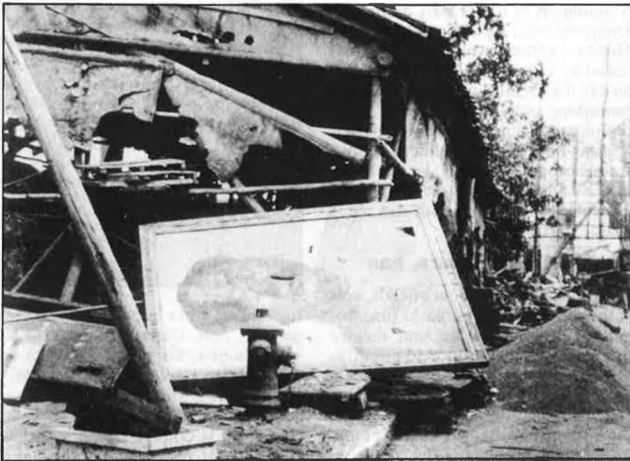
Dalt, el Dalai Lama, ara a l'Índia. Baix, la foto de Mao, en uns enderroc d'una ciutat xinesa.

Un expert en minories xineses ha dit: «El ressentiment dels tibetans envers els han (ètnia majoritària a Xina) no