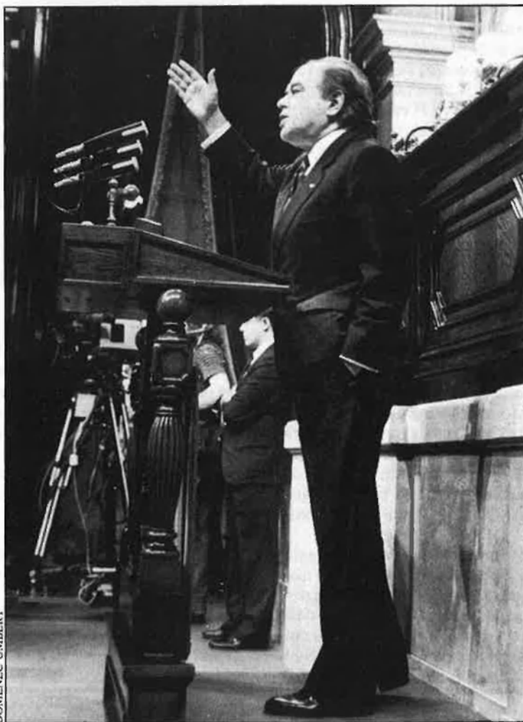
Jordi Pujol va dedicar bona part del seu primer discurs a reclamar la recuperació de les expectatives amb què se signà i es rebé l'Estatut del 79.

Així, mentre el president Pujol, sense fer-ne referència directa en un principi, dedicava bona part del seu primer discurs a reclamar la recuperació de les expectatives amb què se signà i es rebé l'Estatut d'Autonomia del 79, la resta dels grups representats a la Cambra es mostrava disposada a reclamar-ne la modificació. Els socialistes, tot insistint en la seva proposta federal, per a la qual consideren que no cal modifi-