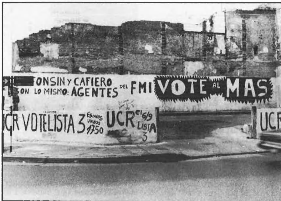
Pintades realitzades durant la passada campanya electoral a Buenos Aires.

rior, el vot de càstig té també matisos, des del rebuig total a l'actuació del govern fins al mateix vot de càstig, malgrat reconèixer la impotència de la democràcia argentina per a fer front a les pressions que exigien, com a mínim, aquestes lleis.