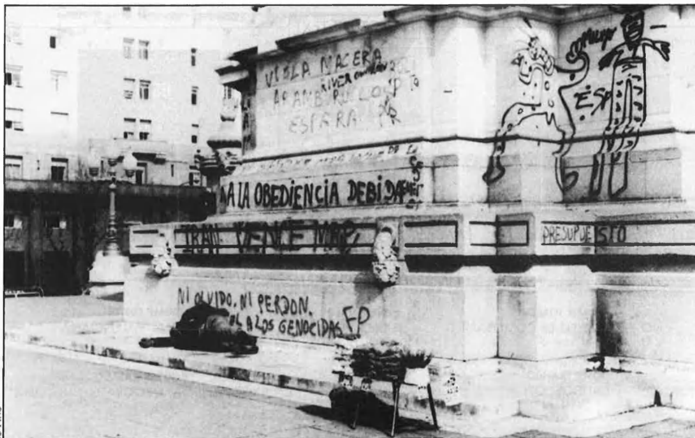
La «Llei d'Obediència Deguda», rebutjada en les parets de Buenos Aires.

vot de càstig, un vot de càstig expressat —en certs casos— contra la política econòmica del govern i, en d'altres, contra la situació en si mateixa. I no perquè creguin que el peronisme pugui fer-ho millor. El mateix partit radical —de cara a fora— sembla conformar-se amb aquesta explicació i no analitza una altra raó que li ha fet perdre vots per la seva esquerra, si bé no necessàriament cap al peronisme. Es tracta de l'aprovació de la «Llei del punt final» i la «Llei d'obediència deguda», que, imposades o no pels poders fàctics, han actuat com a una «semiamnistia» per als repressors del període militar. En aquest cas, com en l'ante-