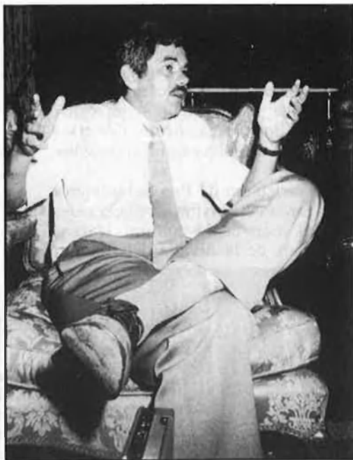
A l'esquerra, l'Ajuntament i, a la dreta, Maragall.

A la carta de dimissió de Pep Subirós, acceptada per Pasqual Maragall, seguí una tensa conversa entre l'alcalde i Martínez Fraile, que acabà amb l'anunci de la