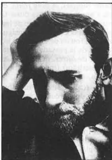
D'esquerra a dreta, Sciascia, Mann, Burguess; Yourcenar, Bassani, Durrell i Mishi- ma; Canetti i Pirandello.