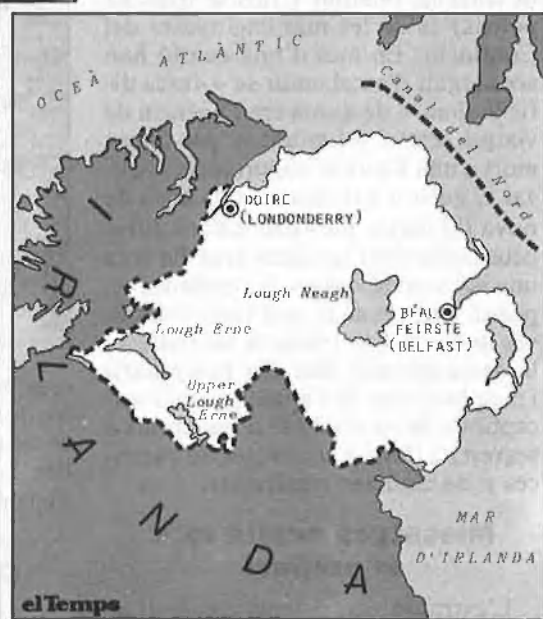
Frontera que divideix Irlanda.