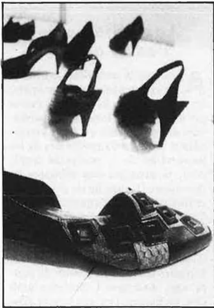
Dalt, model de Diva Internacional. A la dreta, sandàlia de Carpena.

alguns estands semblen parades de mercat de plaça veïnal—, la FICC funciona. És a dir, els fabricants venen les seues produccions i creen expectació. Enguany la cadena nord-americana de televisió Network retransmetrà, el proper 9 d'octubre, a través de 600 canals, un programa a una hora dedicat al certamen i al calcer estatal.