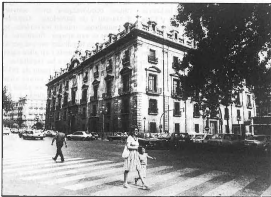
Audiència Provincial de València: centre de tota la premsa del país.

Potser això no se sabrà mai i aquests macarrons i les madames seran oferits a l'opinió pública com el tot. □