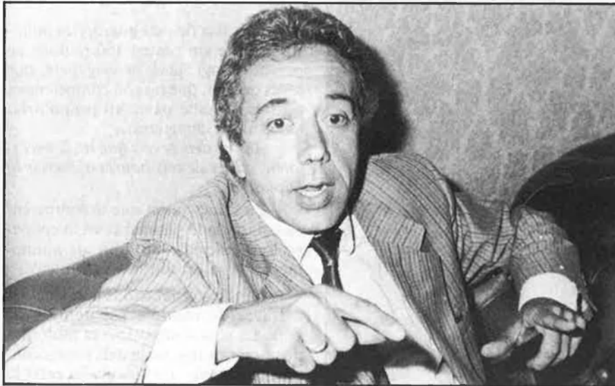
«A Lleida, Tarragona o Girona no volen sentir parlar de província única».

—Si m'ho haguessin dit fa vint anys, m'haurien fet molt content. □