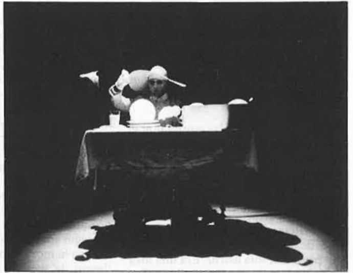
A l'esquerra, La Cuadra ; a la dreta, Comediants , amb «La nit». Baix, Teatr Nowy: «La fi d'Europa».

muntada el 1980, i hi fa una reflexió sobre la fi de la civilització actual, de la qual dona «una visió pessimista», segons ell. Bye bye, Beethoven marca una diferència important amb els espectacles precedents dels Joglars, perquè s'hi fuig de la farsa, de les referències a la realitat quotidiana i no hi ha ni un sol gag. Marcadament expressiionista, el text està al servei de la imatge; en ella, però, els actors han après rus per barrejar paraules d'aquesta llengua i de l'argot militar anglès, i tenir, al mateix temps, un so esclau a la parla.