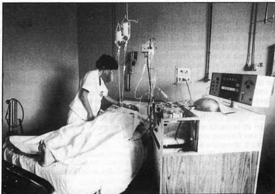
Insalud: Caos i conflictes que es repeteixen.