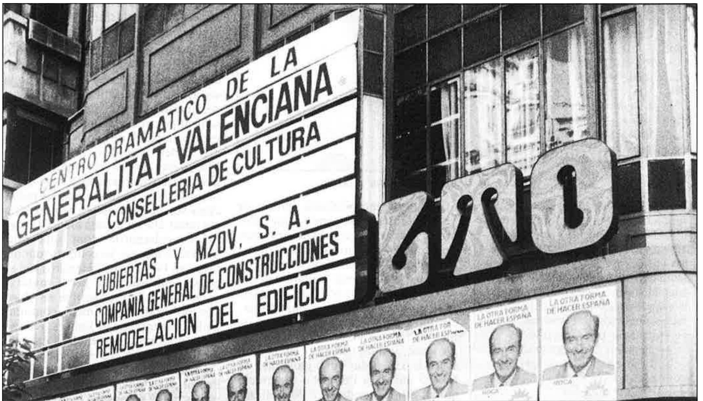
Centre Dramàtic, una espera massa llarga.