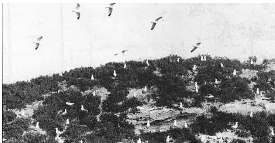
La utilitat pública és un argument difícilment rebutjable pels opositors a l'avantprojecte.

En qualsevol cas, el projecte ja ha instrumentat o ha provocat que certs interessos, molt concrets, instrumenten tota una simfonia de soroll al seu voltant. En un futur, potser, el soroll variarà la intensitat, però la qüestió serà la mateixa, les nous; una costa, fins ara, indefensa, una relació propietat privada-usdefruit indefinida i unes competències al respecte poc determinades. •