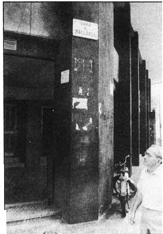
«Número 80, al carrer de Mallorca.

Mentrestant, Barcelona ha estat centre d'una reeixida operació policial, i els responsables de seguretat de l'estat han donat de seguida, inclús, els noms dels responsables d'operacions aïllades, com ara l'estacionament del cotxe-bomba que va ocasionar la massacre de l'Hipercor. Els mateixos responsables, però, han de fer públiques altres investigacions derivades de dos mesos de seguiment policial. Per exem-