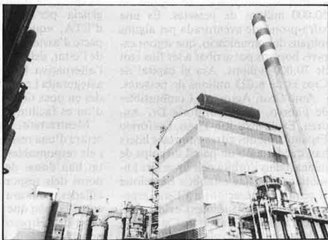
L'operació Cros-Kio-Torras Hostench (dalt) significa la victòria en la pugna per encapçalar el sector químic.