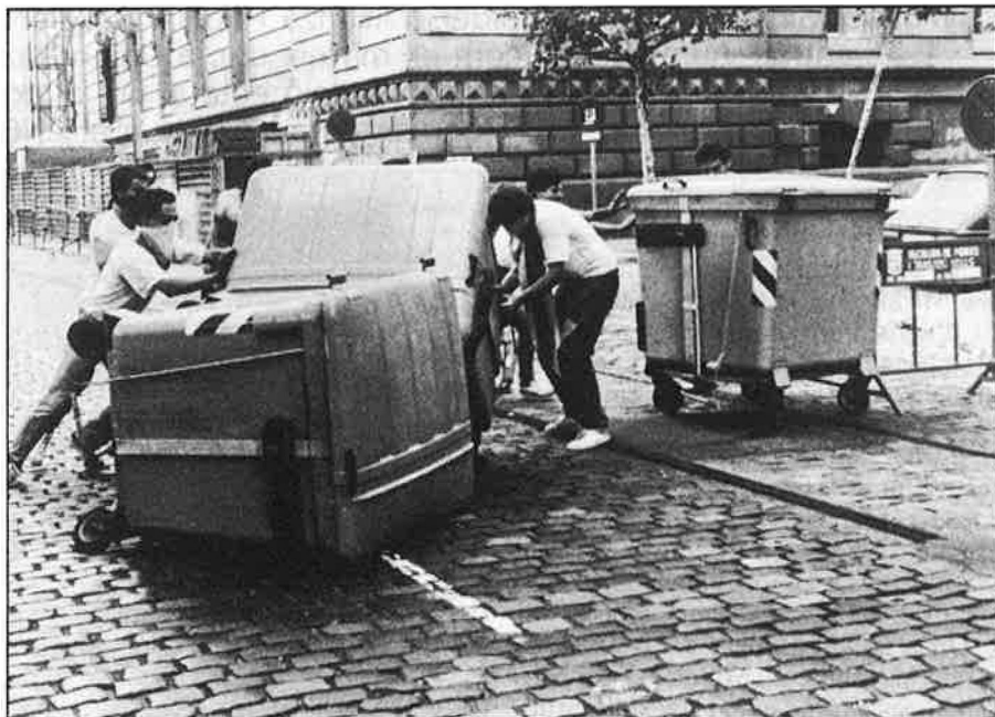
L'independentisme més radical ha jutjat l'actitud dels parlamentaris com de «renúncia».