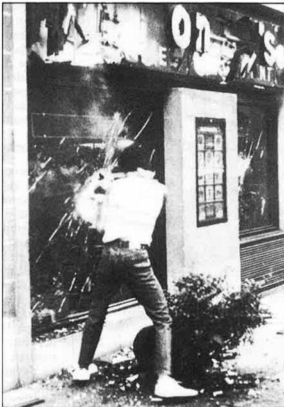
Els independentistes asseguren que els únics enfrontaments seran amb la policia, si provoca.

L'ajuntament de Barcelona celebra l'Onze de Setembre amb un acte, en la vesprada del dia 10 i al Saló del Consell de Cent, en què l'historiador bri-