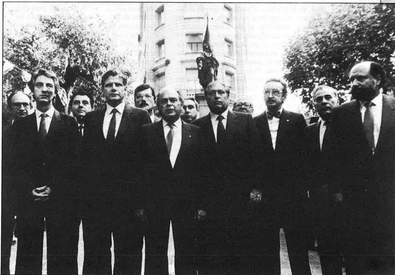
Les dues cares de la Diada: Institucional i reivindicativa.

versari en què la «normalitat», el caràcter «simbòlic» i la institucionalitat, són els trets més desitjats pels organitzadors. Només les formacions cíviques i polítiques independentistes seran, doncs, presents al carrer amb actes públics, mítings i manifestacions. Potser amb l'excepció del Partit dels Comunistes de Catalunya, que ha convocat una manifestació el matí de la Diada, tant la Crida, els dos sectors del Moviment de Defensa