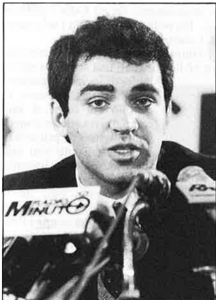
Kaspàrov: «Campomanes odia la llum».

Dilluns, 17 d'agost. Kaspàrov vola a Sevilla, amb escala a Madrid, per contractar publicitat amb el director