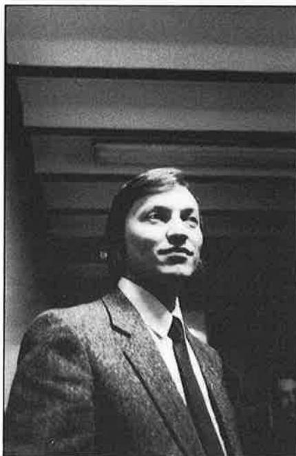
Kaspàrov-Kàrpov, el nou matx, aviat a Sevilla.

Allí hi ha, també, d'altres membres de la directiva: l'holandès Jan Timman i la seua bella esposa negra, l'increïble