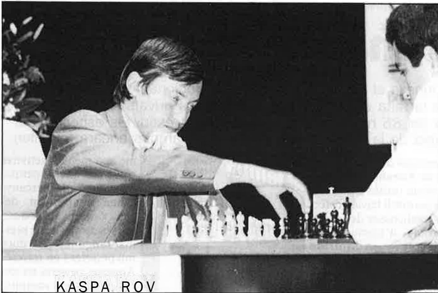
En el pròxim mundial el seguiment de la premsa pot conèixer un canvi revolucionari.

va donar per l'espatla. Parcialment, n'és una víctima més.