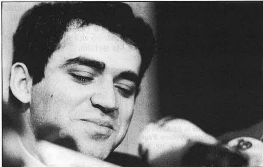
«Tants anys de desordre no acaben així com així»

— És clar que és un risc inevitable en tot procés electoral, però resulta difi-