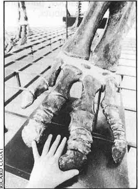
La comparació palesa la grandària del dinosaure.

«No hi voldria entrar en polèmica, perquè comprenc que se senti ferit, però és una persona que no sap reconèixer les seves limitacions, i és una llàstima perquè per la meua part només hi ha que voluntat d'enteniment i de concòrdia, i, a més, sóc conscient que entre nosaltres hi ha una dependència mútua: ell ens ha de dir on són els jaciments i nosaltres fer les excava-