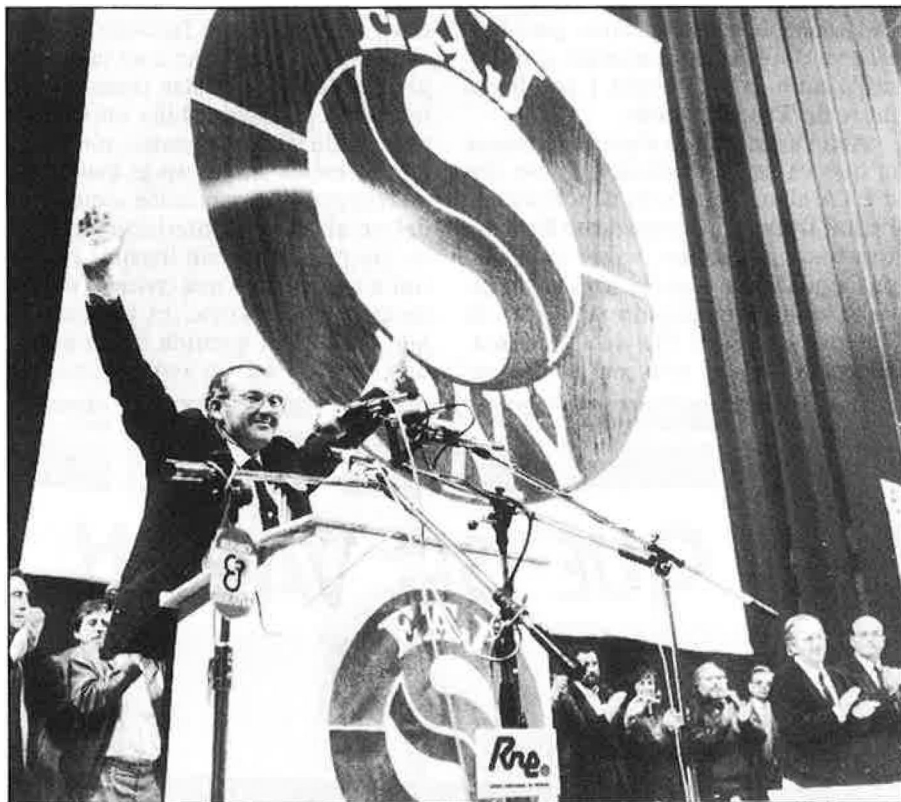
Segons els refugiats, la pèrdua electoral del PNB «agilita el pacte».

Posats en contacte amb el PNB, EA i EE, portaveus d'aquests partits han