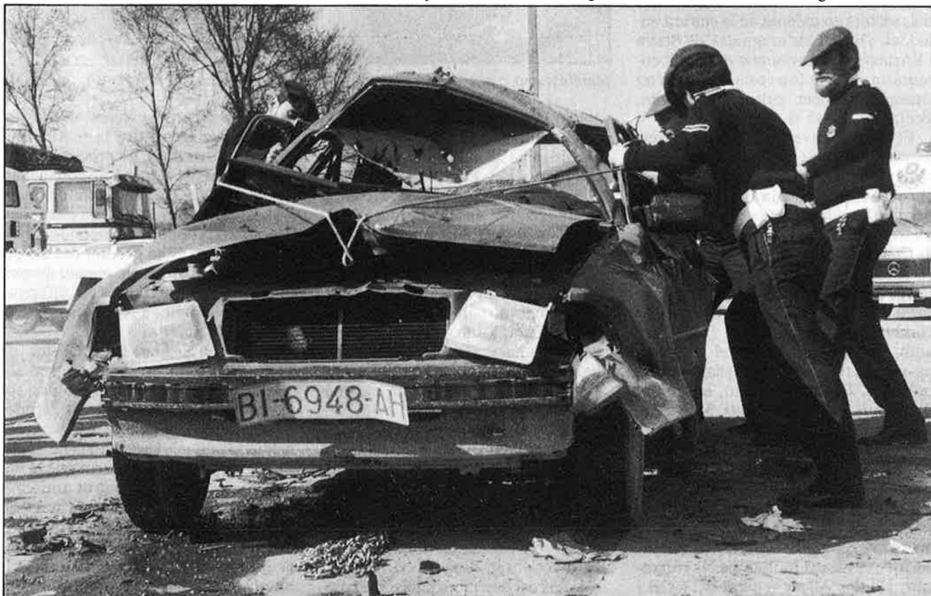
Mentre el president González parla de «contactes per eradicar la violència», Interior ni fa sí ni fa no.

«^Problema basc?» —preguntem. «Sí, problema basc» —responen. No és el problema d'ETA, o el problema de la violència, com el planteja el govern en el seu discurs, allò que es discuteix o allò que discuteix ETA. Com veus, hi ha una diferència fonamental. Ni més ni menys que la que puga haver-hi entre una negociació sobre