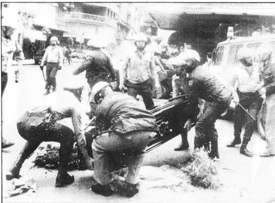
«A mesura que el govern espanyol faça passes dins les reivindicacions de l'alternativa KAS, retrocediran les accions d'ETA progressivament.»

fons polític i la que tracta sobre el futur de l'organització exclusivament. Ja veus que, mentre un es plafleja com fer desaparèixer el problema basc, la preocupació de l'altra part és com fer desaparèixer ETA».