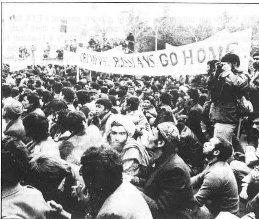
Manifestació d'afganesos clavant de l'ambaixada soviètica a Teheran.

apaivagar el descontentament dels kazaks i ara les botigues de menjar d'Alma Ata estan millor abastides que mai, el metro en construcció serà inaugurat abans del que s'havia previst i s'han foragitat un elevat nombre de quadres i dirigents corruptes. També s'han pres mesures com la intensificació del control d'accés a l'universitat i s'ha incrementat la lluita contra tota mena d'expressions nacionalistes en el teatre, la