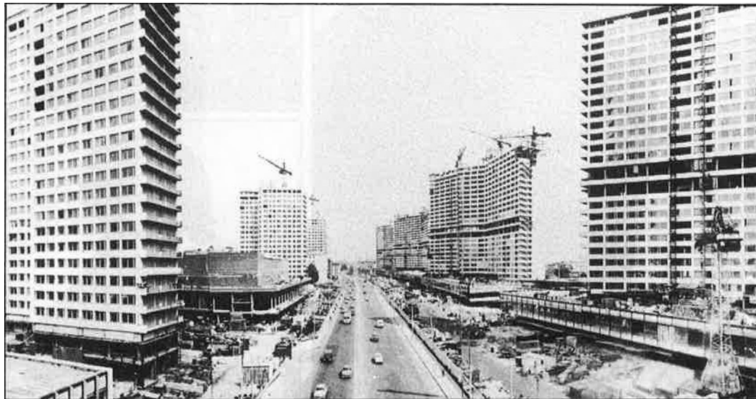
Moscou; el centralisme necessita més i més habitatges.

colons alemanys que el segle XVIII s'establiren al Volga. En constituir-se l'URSS, van obtenir una república pròpia, però fou abolida per Stalin el 1941 i foren deportats en massa a Sibèria i Kazakhstan perquè el dictador temia que no col·laboressin amb els invasors alemanys. En gran part mantenen la seva llengua i cultura originàries i, a diferència dels tàtars, no demanen tornar al seu territori, sinó que molts volen emigrar a la República Federal Alemanya. Es calcula en cent mil el nombre d'emigrants potencials. De fet,