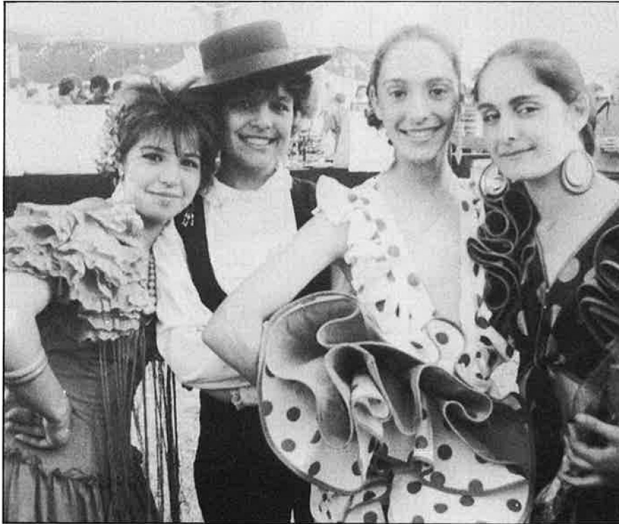
«i,Com permeten que la Fira d'Abril es faci en un suburbi com Barberà?».

Aquesta «publicitat específica», juntament amb la voluntat d'organitzar viatges i excursions a Andalusia per tal de conèixer la «cultura del país», apunta directament a un finançament gens allunyat al que realitza determinada marca de vins i embotits amb la FE-CAC. Potser per aquesta raó, des de les planes d'un diari madrileny, s'ha arribat a parlar de la possible relació de Juan Guisado , antic cap de la FE-CAC i ex-representant de la marca Crismona, amb el projecte. De semblant manera, l'origen andalusí de bona part de la revista no fa més que afegir nous interrogants als interessos que s'amaguen darrere el projecte. Recentment, Obregón i Hidalgo viatjaren a Sevilla —on el PAC ha aconseguit un fort ressò dins la premsa local— amb el propòsit d'entrevistar-se amb el President de la Junta, José Rodríguez de la Borbolla , «Pepote», cosa que no aconseguiren. Un altre dels objectius de la visita era el de convidar l'alcalde de Jerez, Antonio Pacheco , a visitar Catalunya.