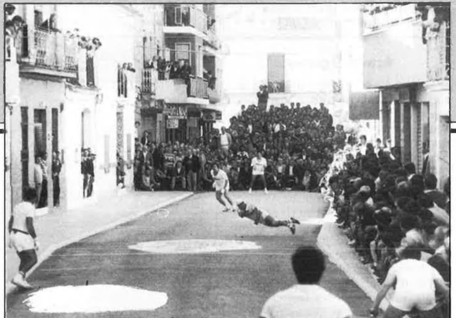
Partida de raspall a Rafelbunyol.

Les comarques on es juga a «raspall» són, principalment, la Safor, la Costera, la Vall d'Albaida i la Marina, a nivell professional, i els trinquets més importants: «El Zurdo», de Gandia, Oliva, el Genovés, Castelló de Rugat, Canals, Castelló de la Ribera, Benidorm i Gata de Gorgos.