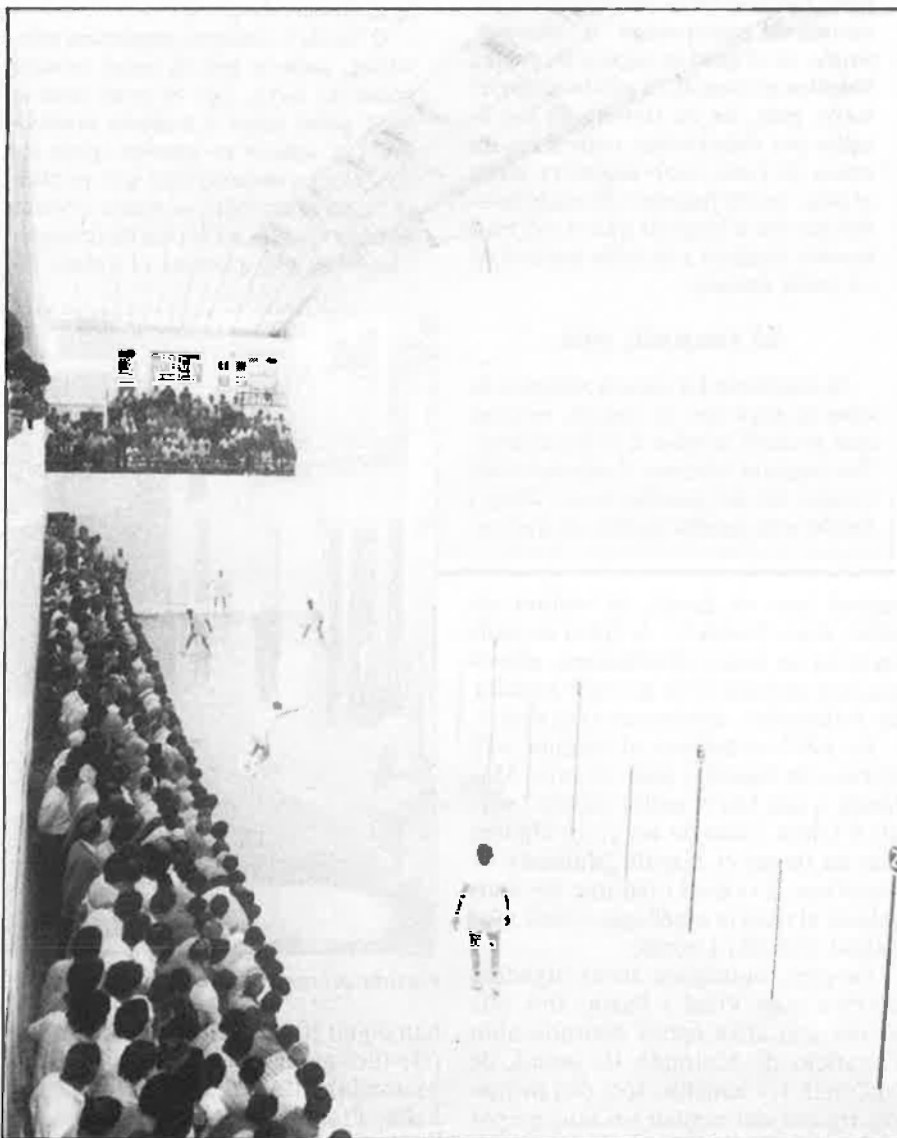
El trinquet «El Zurdo», el segon en importància de tot el País Valencià.