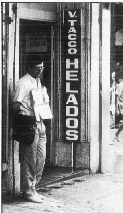
Els comerços menuts, socis de les associacions.

A l'altra banda, l'excepció que confirma la regla, Avidesa , única empresa de capital exclusivament autòcton.