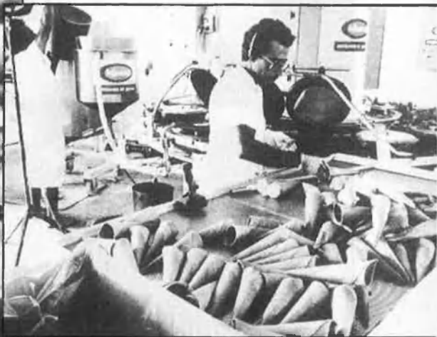
La tecnificació i la publicitat, bases de les grans empreses.