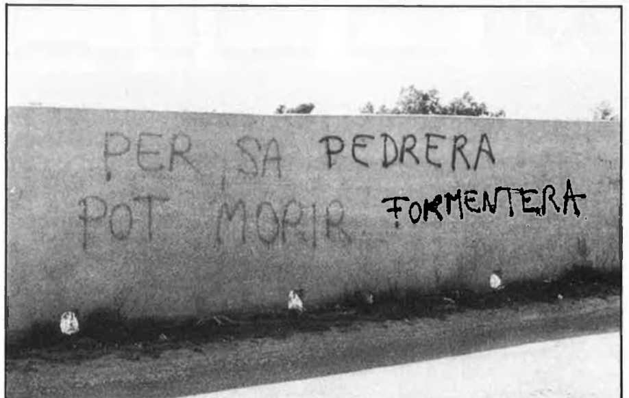
Punta Pedrera i Can Marroig, terrenys veïns a S'Estany, ja han disparat el preu del sòl.

Els terrenys de S'Estany des Peix estan registrats a nom de Formentera, SA, però les accions d'aquesta societat són des de fa un any en mans d'Interpart Spain, SA, que és la delegació de Parretti a l'Estat espanyol. En les societats anònimes es molt difícil saber què i qui hi ha darrere; però l'ajunta-