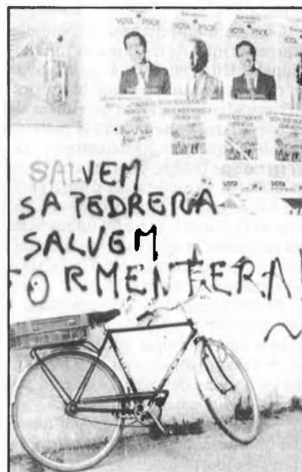
Un crit unànime contra Parretti.