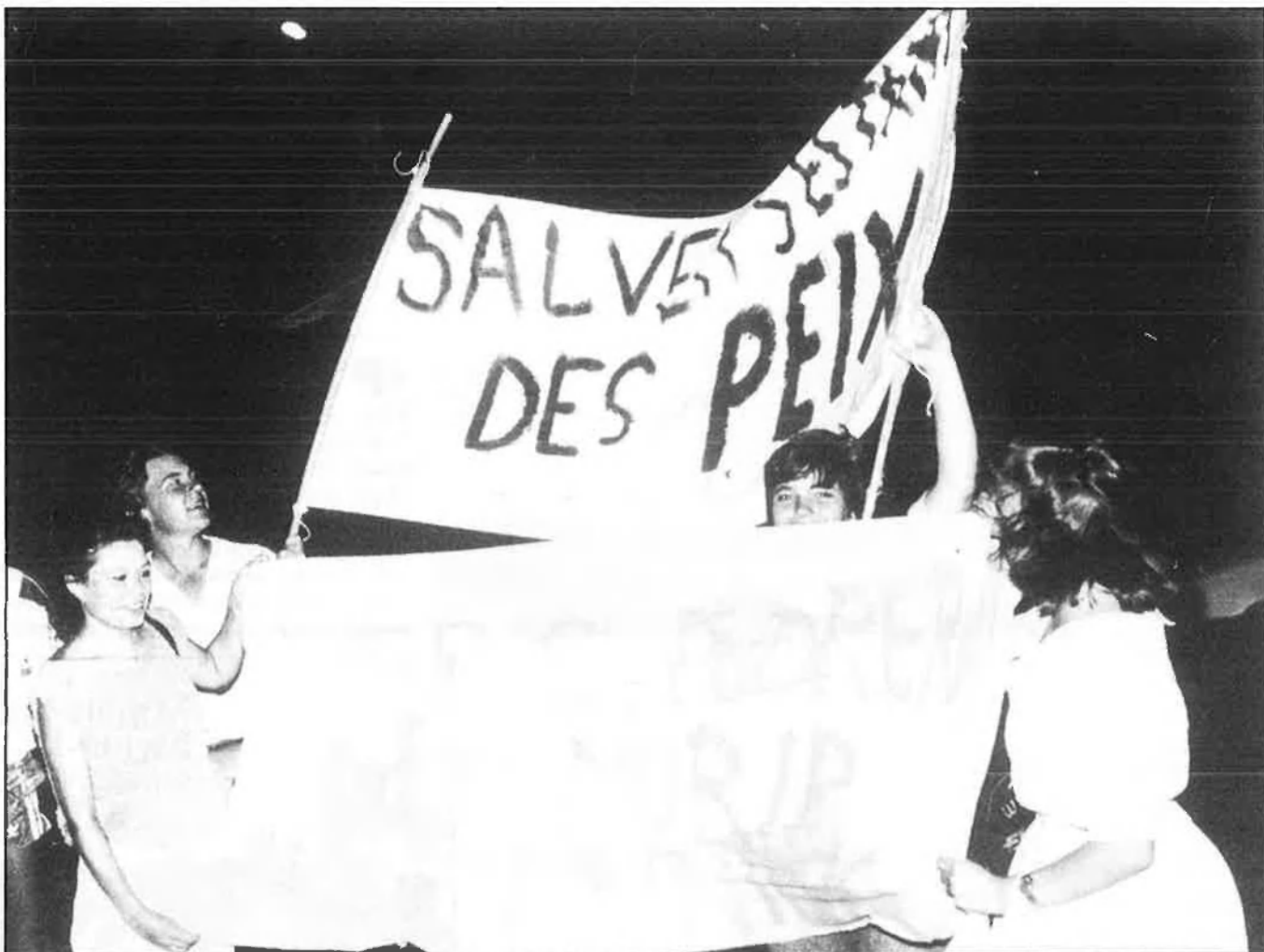
Tots els formenters s'enfronten aplegats als projectes de Parretti.

provocar un amotinament per part dels formenters. Però ja ha aconseguit que el valor dels terrenys s'inflés com una bombolla. En això Parretti és un especialista.