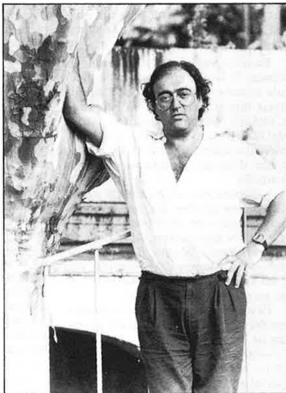
«L'espectacle ja no és un exercici d'investigació».

—És el final de l'obra; passa que està tractat i hi ha alguns detalls dife-