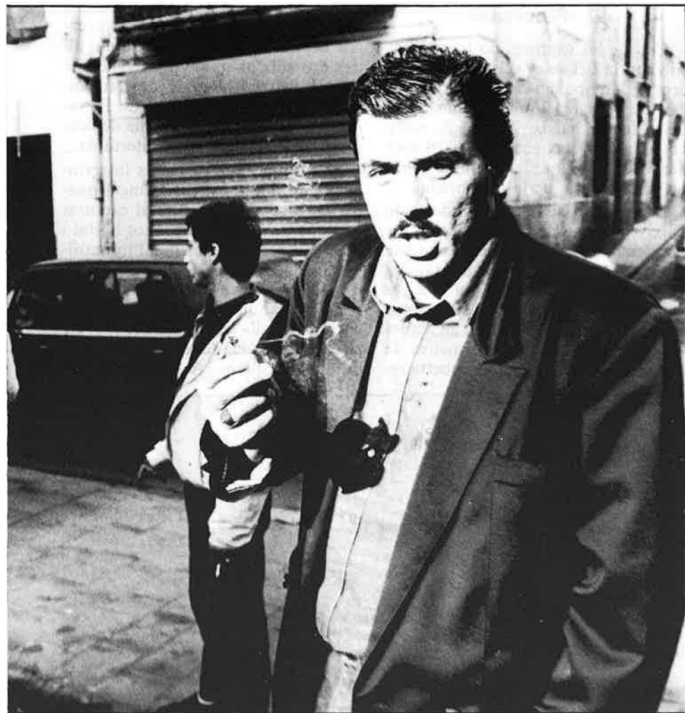
Operació primavera o maquillatge: només es molesta els traficants menuts.