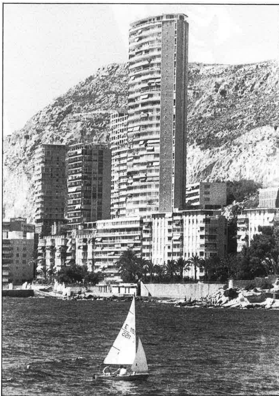
Alacant: amb el camuflatge del bon temps un innocent veler pot servir per a allotjar una bona partida de droga.

Més d'una tona de haixix intervingut és un bon mos. Exactament quatre vegades més que el total capturat en l'operació primavera a tot l'estat i dues mil vegades més que l'insignificant paquet cobrat a Alacant i les comarques valencianes meridionals. Prou per certificar que davant els durs avanços del «cavall» i de la selectíssima i cara cocaïna torna, des d'Àfrica, la moda del «xocolate». A tongades. •