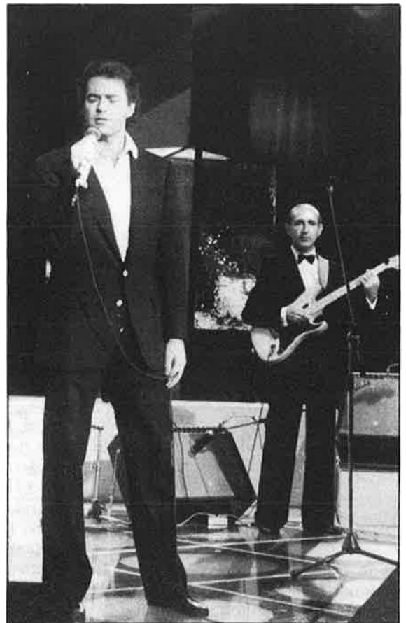
Bertín Osborne, famós i televisiu.

els ajuntaments contracten. Són els més melòdics, els més «moderns», els més autèntics. Són els que han pres el relleu a la Lola , en altres temps faroana i ara capficada a justificar fraus a hisenda, i al Manolo del porom-pom-pom. Entre tot això, una mica, només