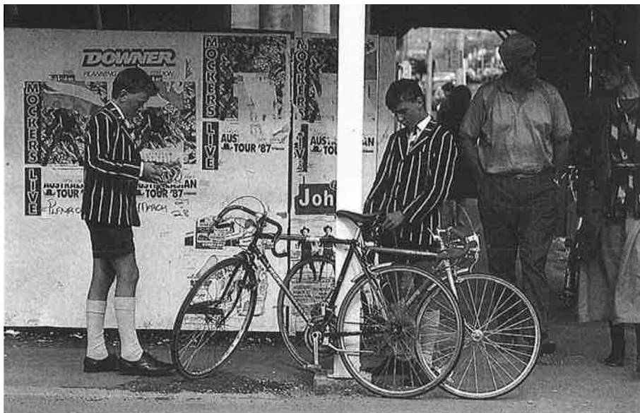
Una societat occidental, amb un altíssim nivell de vida.

El 1965, el PNB per càpita de Nova Zelanda era el tercer del món. El 1976 havia baixat al dinovè. El creixement econòmic entre 1965 i 1982 va ser el més baix de l'OECE. Durant aquest període, el PNB per càpita va créixer només el 29 per cent, contra el 238 al Japó, el 93 a França i el 60 a Austràlia. Les exportacions van augmentar en un 40 per cent, contra el 990 les del Ja-