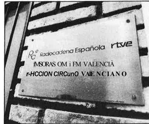
Estudis de RC a València.

ja que desapareix una xarxa o circuit valencià de Radiocadena, tot i que al- gunes de les seues emissores es trans- formen en centres de RNE. Tanmateix, hi ha previst el naixement de Radio Cuatro i Radio Cinco, dos nous pro- grames de la cadena resultant de la fusió de RCE i RNE. Ració Cuatro —encara no se sap si emetrà per ona mitjana o per freqüència modulada— esdevindrà el canal d'àmbit autonòmic i hauria de realitzar una programació íntegrament en català per a tot el país a través de les emissores del circuit. Ra- dio Cuatro haurà de fer front al rept de competir amb la programació de Ràdio Autonomia, la ràdio de la Ge- neralitat valenciana que naixerà amb uns plantejaments molt semblants —servei públic i àmbit de cobertura de tot el País Valencià—. L'única diferèn-