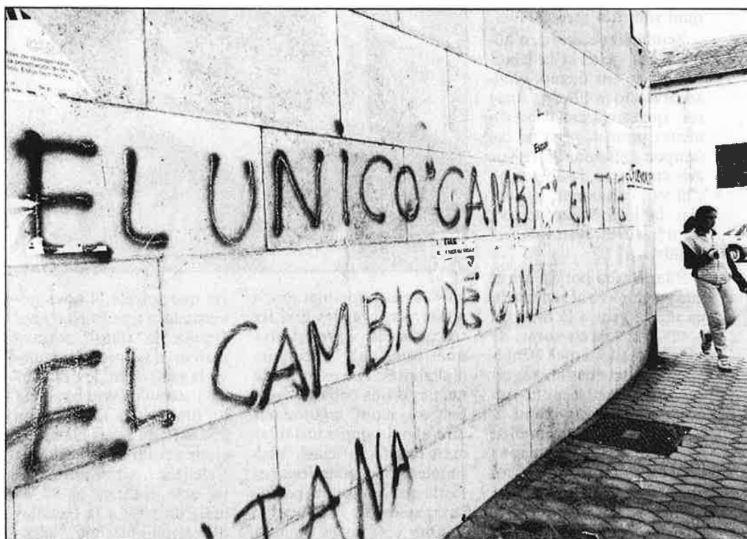
Pintada al·lusiva als «canvis» dins RTVE a València.