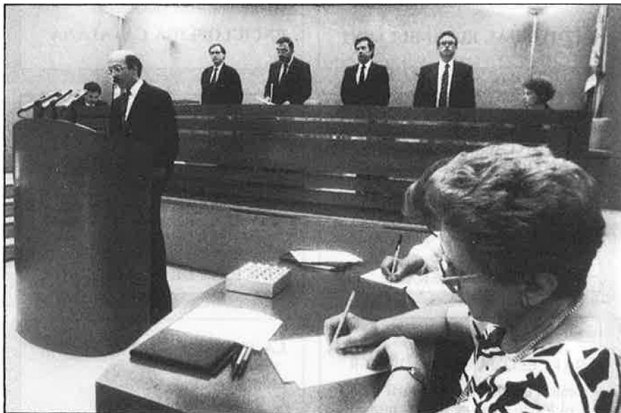
Les noves Corts hauran de votar, en la pròxima etapa de sessions, la composició del Consell d'Administració de RTW.

com fins ara, amb una programació d'àmbit estatal en OM i realitzant uns informatius i uns programes per a tota la cadena, de manera que les emissores locals de RNE esdevindrien una mena de corresponsals i de col·laboradors perifèrics per a donar contingut als espais que es realitzen des de Madrid. Radio Dos tampoc no patirà cap canvi destacable, ja que se'n mantindrà l'actual programació, que es basa