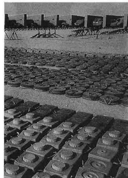
van presenciar els corresponents erra pres a l'exèrcit marroquí. A la a, ara en poder del Polisàrio.