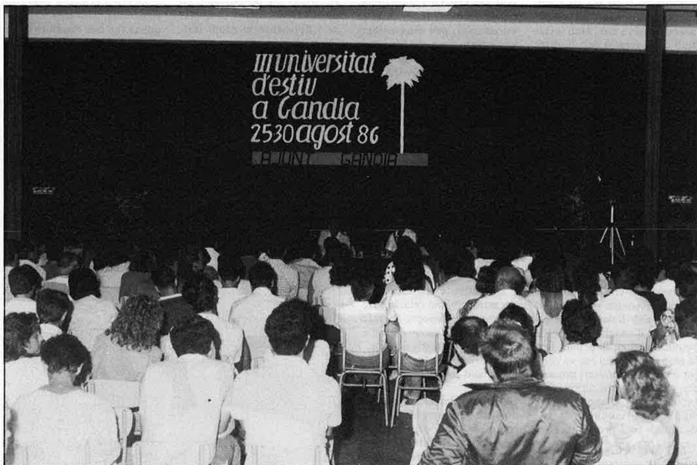
GANDIA D'ESTIU: PLATAFORMA DE DEBATS CULTURALS