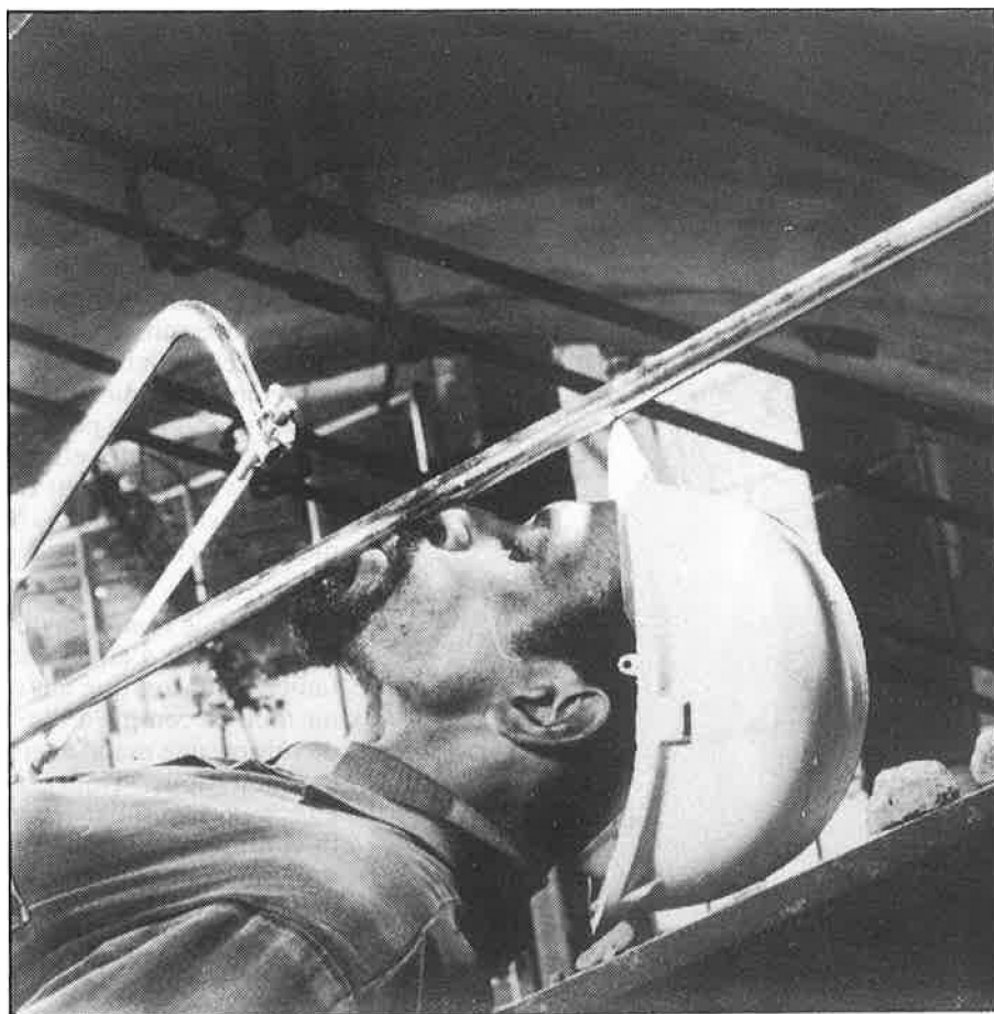
Fastenaekens 6 i, baix, «retrat», de Brian Griffin.

abans de muntar un numeret com el que s'han marcat al voltant d'aquest àudio-visual. Aquesta exposició fou inaugurada pel ministre de Cultura d'un govern de dretes, com és el francès.